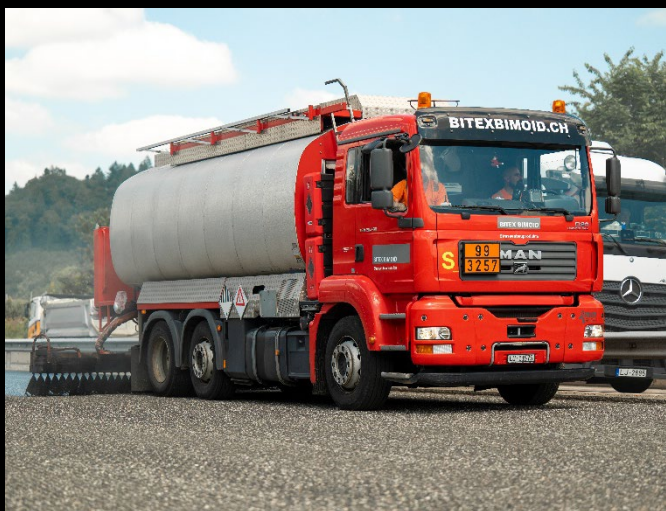
Spruzzatrice a caldo